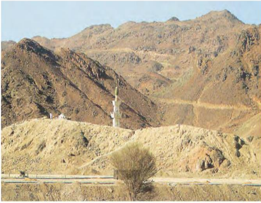
Uhud'da Okçular tepesi

Mekke Orduları 11 Mart 625'de Mekke'den Medine'ye yürümeye başladı. Bu saldırı Mekkeliler tarafından Bedir Muharebesi'ndeki kayıplarının öcünü almak ve Müslümanların yükselen gücünü kırmak için yapıldı.