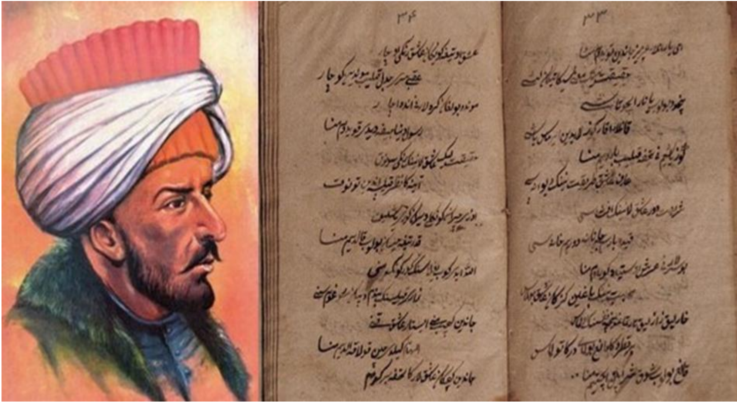
Kutadgu Bilig (Günümüz Türkçesi ile: Mutluluk Veren Bilgi ya da Devlet Olma Bilgisi) , 11. yüzyıl Karahanlı Uygur Türklerinden Yusuf Has Hacib'in eseri