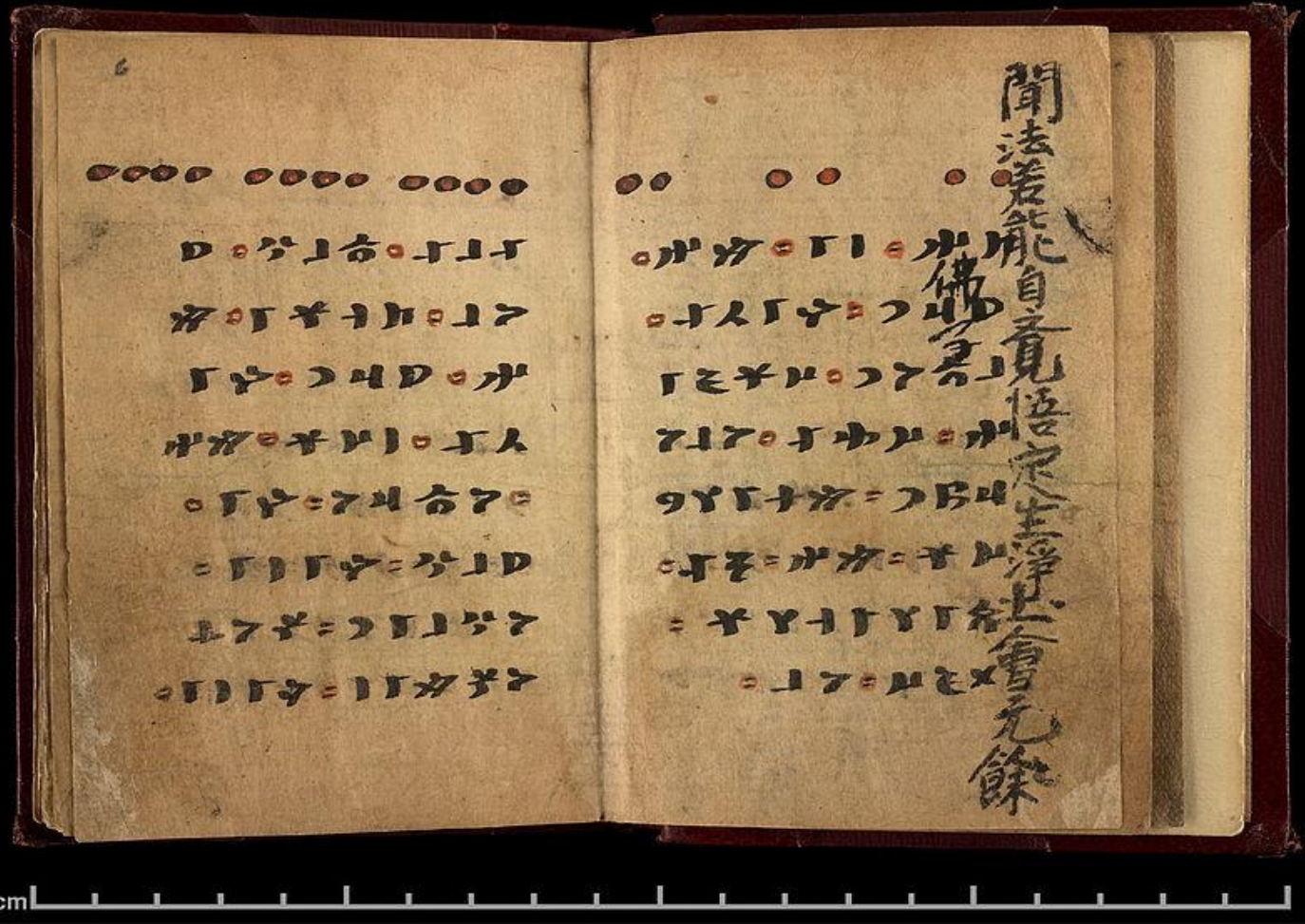
9.Yy a ait FAL KİTABI