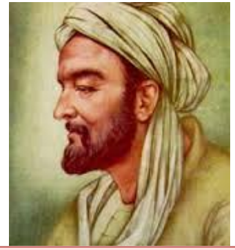
12.Yy Edip Ahmet Yükneki