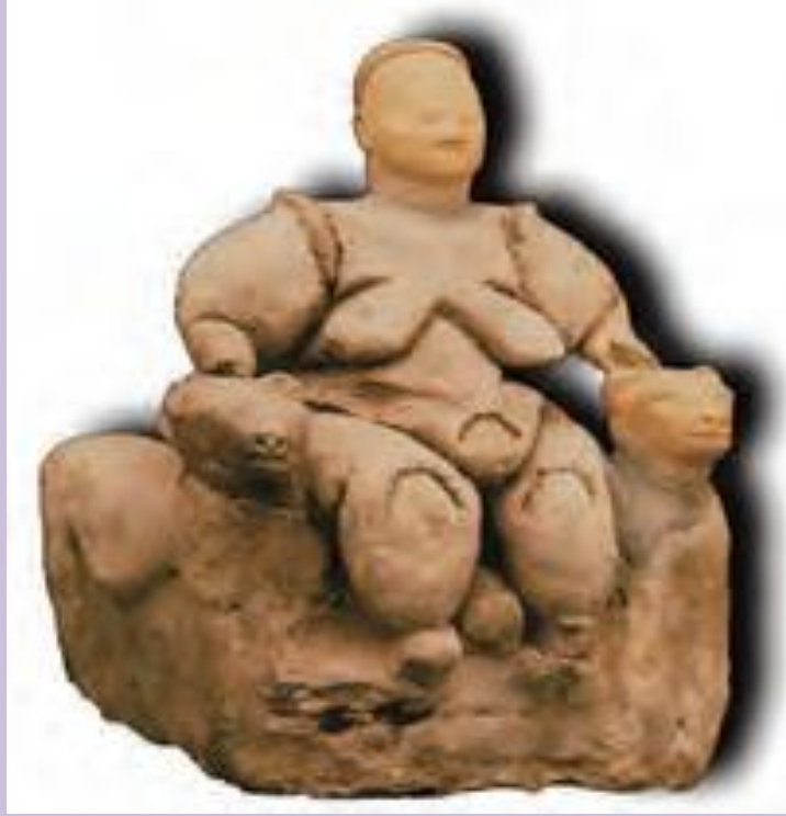
Dođa ve bereket Tanrıçası Kibele