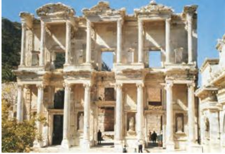
Celcus Kütüphanesi'nden bir görünüm (Efes, İzmir)