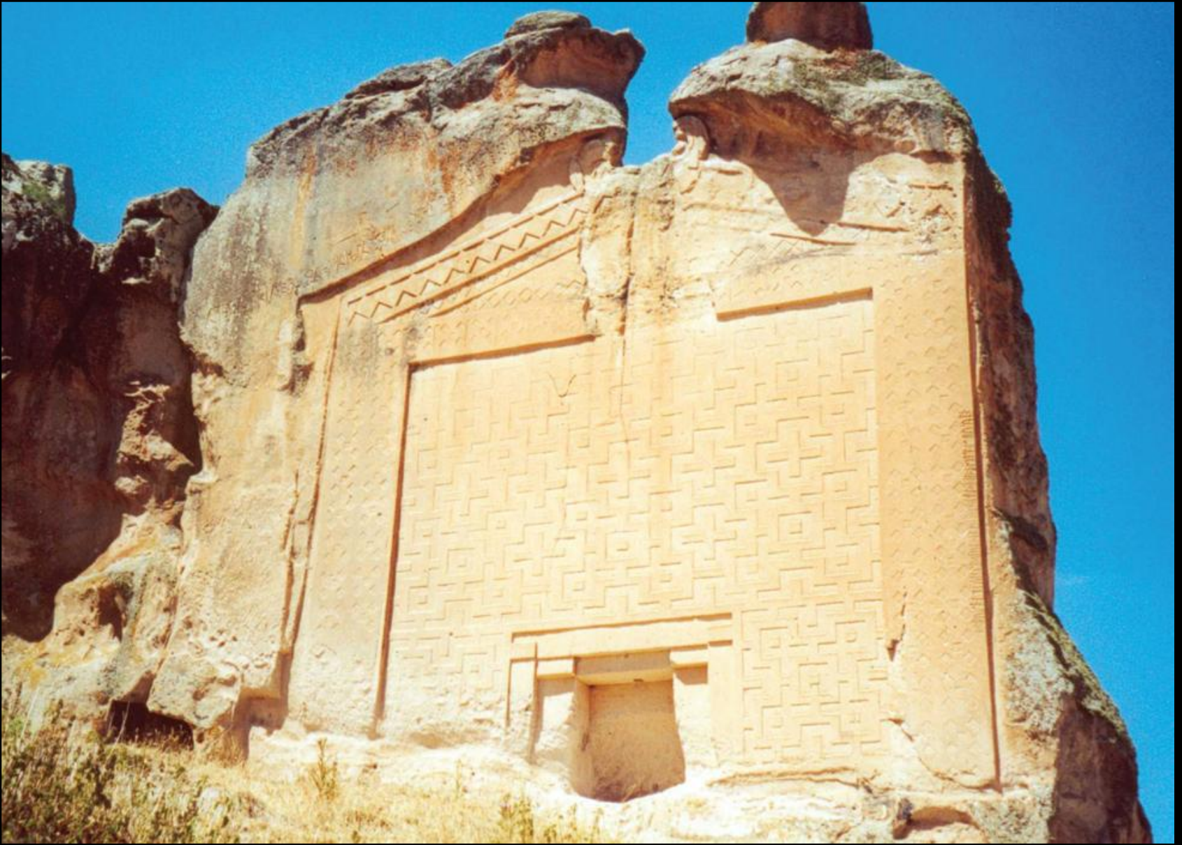
Kral Midas'ın mezarı