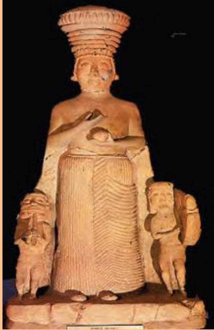
Hititlerin Ana Tanrıçası