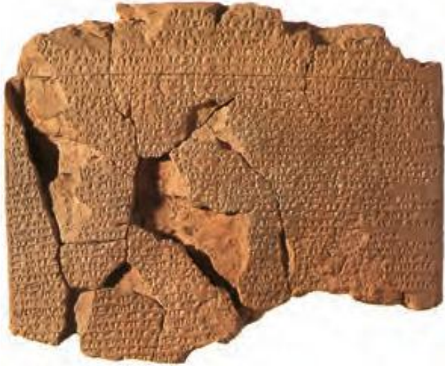
Kadeş Antlaşması'na ait çivi yazılı bir tablet örneği