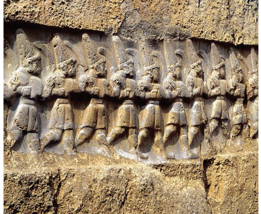
On iki cehennem tanrısının kfile halinde yürüyüşleri, Yazılıkaya, Hattuşaş - Çorum