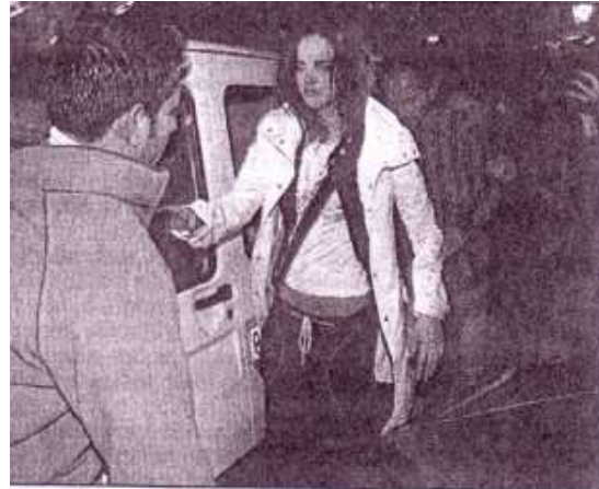
Ayakta zor durmakta zorlandı