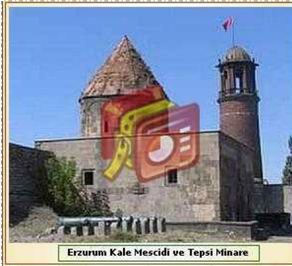
Erzurum Kale Mescidi ve Tepsi Minare