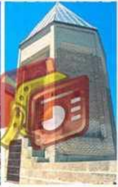
Niksar Melik Gazi Kumbeti