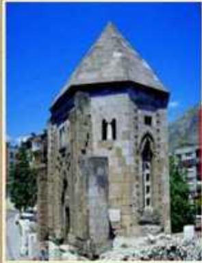
Amasya Halifet Gazi Kumbeti, 1145