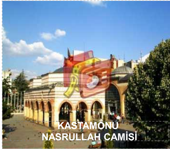
KASTAMONU NASRULLAH CAMİSİ