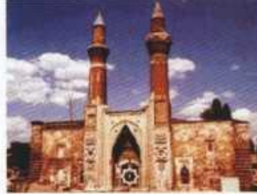
Gök Medrese (Sivas)