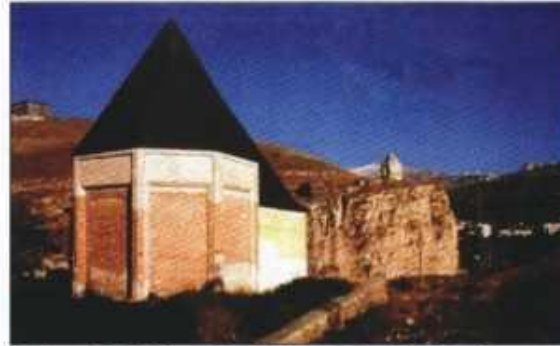
Sultan Melik Mengücek Ahmet Gazi Türbesi