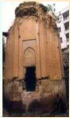
Niksar Kırk Kızlar Kumbeti