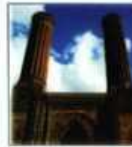
Çifte Minareli Medrese (Erzurum)