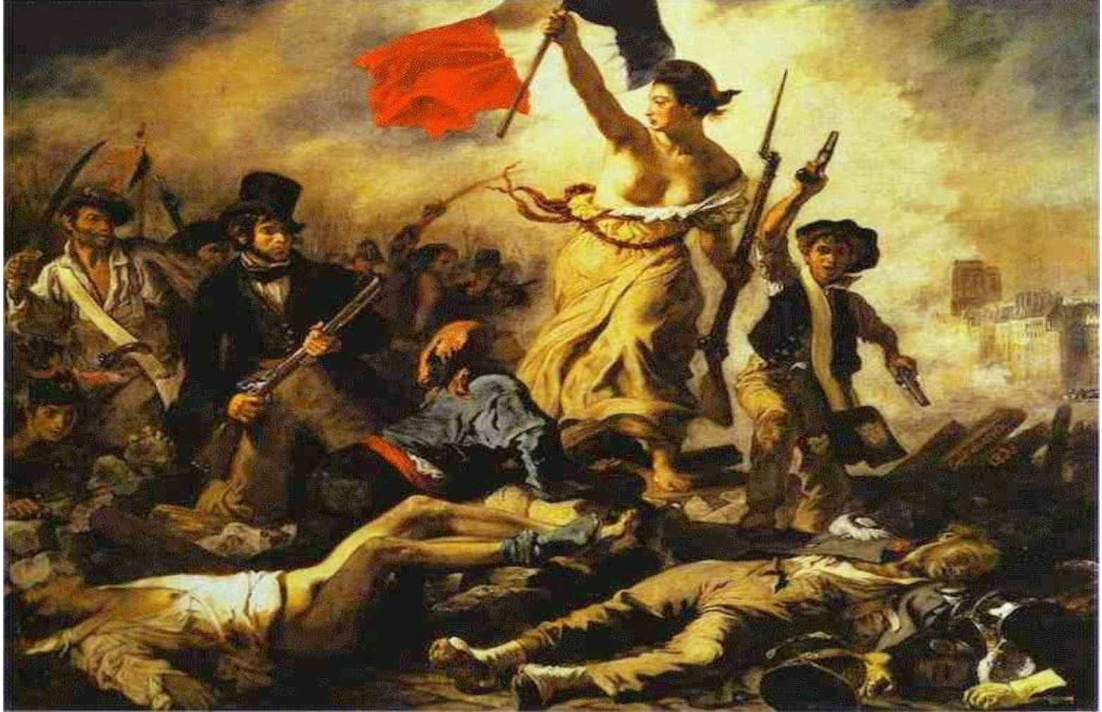
Fransız İhtilalini Gösteren Temsilî Resim