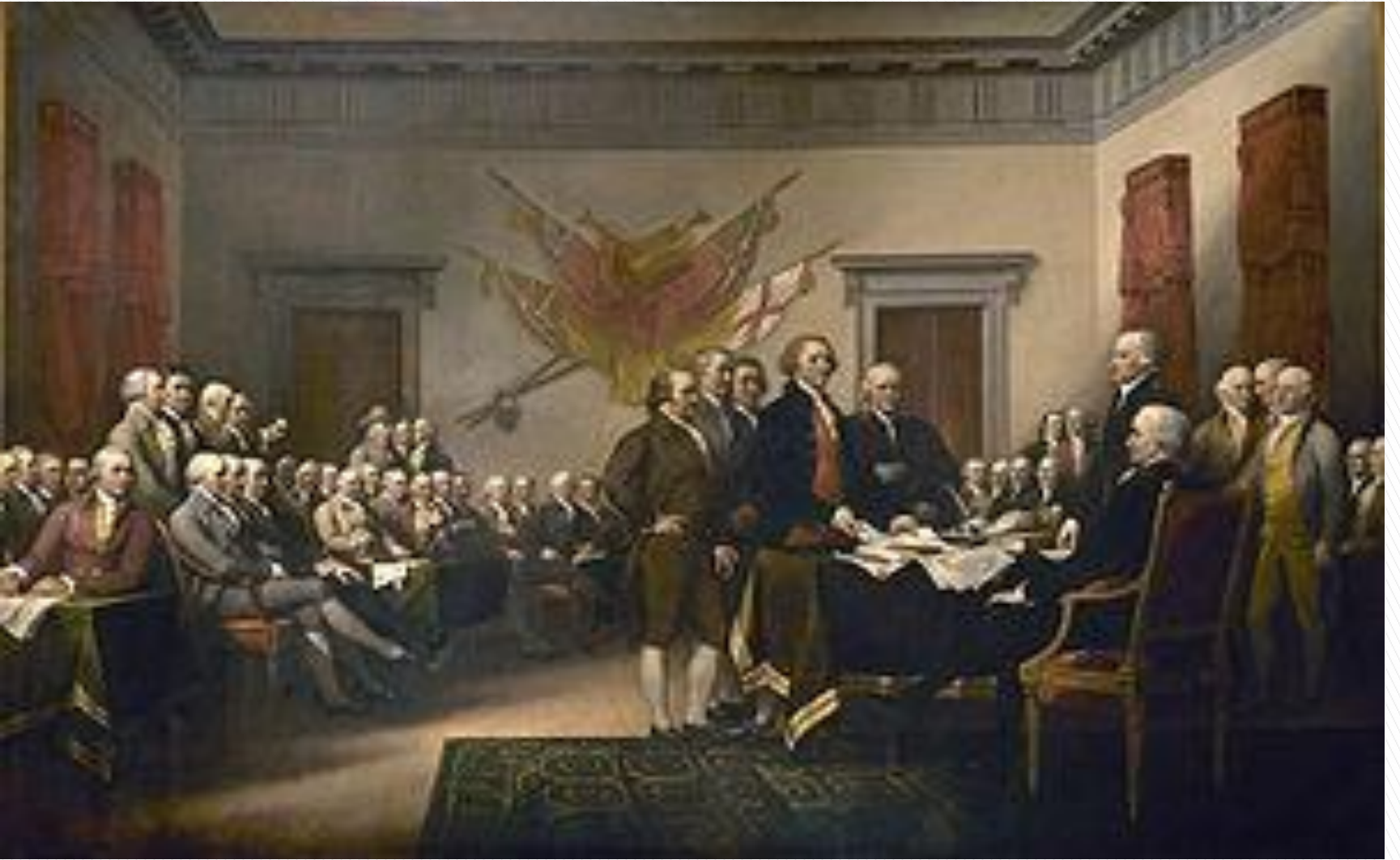
John Trumbull'ın Tablosu: Kongrenin Bağımsızlık Bildirisi Üzerine Çalışması