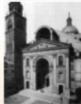
San Andrea kilisesi Mantua 1472

Erken Rönesans İtalyası'nın kültürel yaşamında hemen her önemli gelişmenin öncüsü Alberti'ydi.