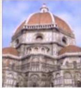
Floransa Katedrali, 1436

Klasik alınlıklı kapı çerçevesi gibi kimi ayrıntılar, Brunelleschi'nin antik yıkıntıları ve Pantheon gibi yapıları, ne gibi bir özenle incelediğini göstermektedir.