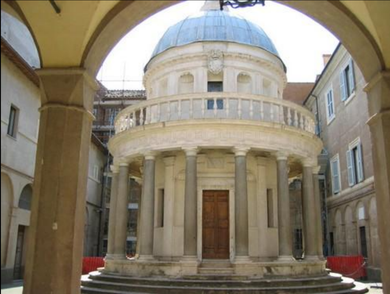
Tempietto Kilisesi, Roma