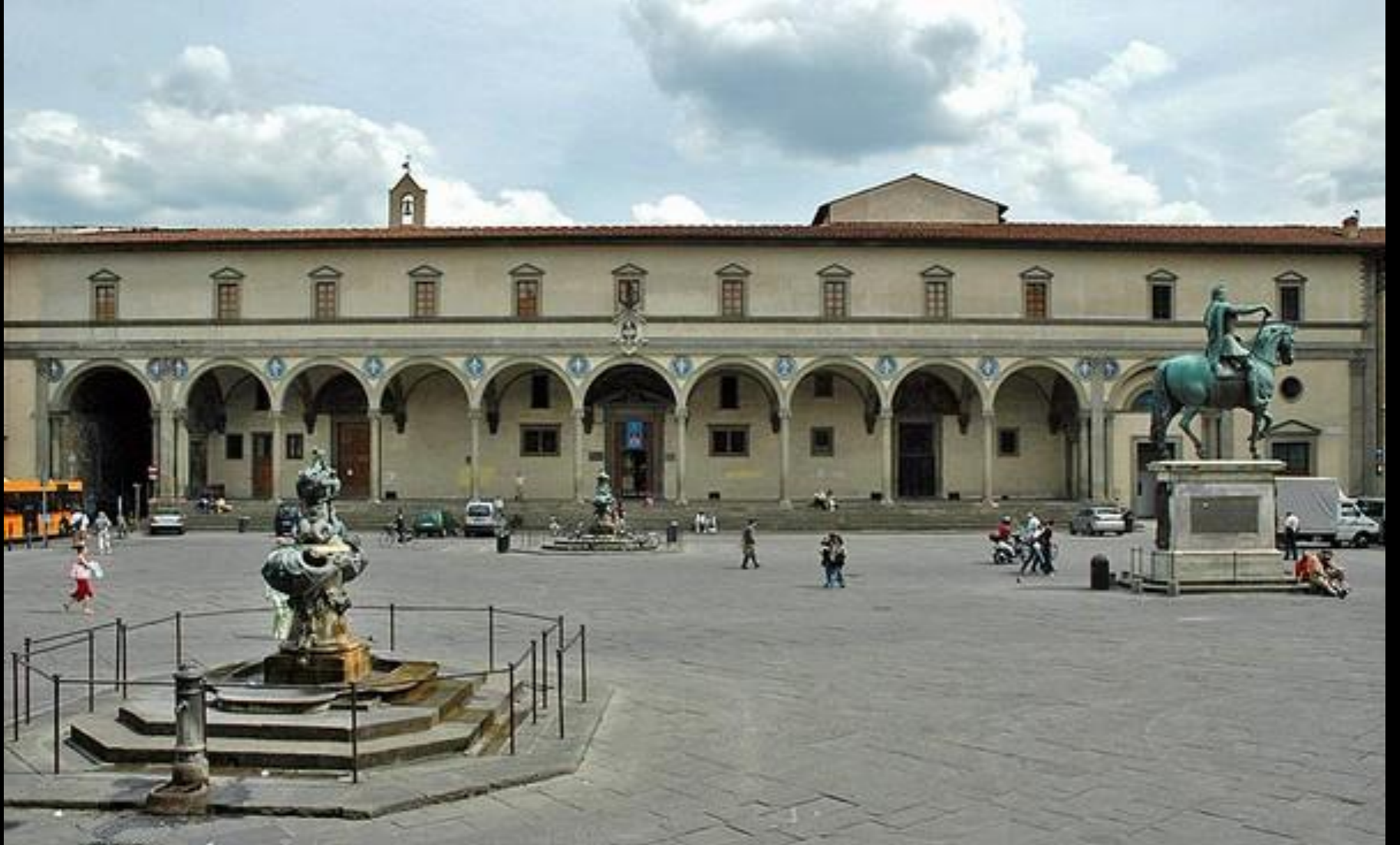
Yetimler Yurdu, Brunelleschi