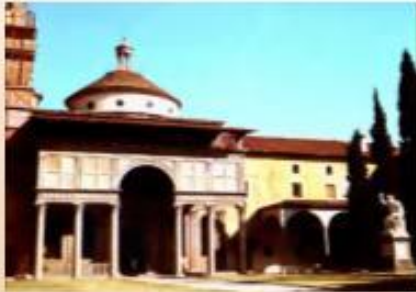
Pazzi Kilisesi, 1430

Floransa'da bu genç sanatçı kümesinin üstün önderi, Floransa katedralinin tamamlanması içinde çalışan mimar Filippo Brunelleschi'dir. Floransalılar, katedrallerinin görkemli bir kubbeyle örtülmesini istiyorlardı, fakat Brunelleschi uygun yöntemi bulmadığı sürece hiç bir sanatçı, kubbenin dayandığı payeler arasındaki kocaman aralığı örtbilecek yetenekte değildi.