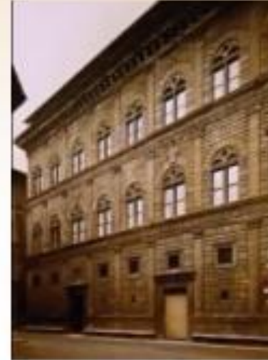
Rucelai Sarayı, 1446-51

Günümüze değin etkisi belirleyici etkisi olacak çözümü bize, zengin bir Floransalı aile için bir saray tasarlayan Alberti buldu. Önyüzü , herhangi bir klasik yıkıntıya pek az benzeyen üç katlı sıradan bir bina çizdi. Ama Alberti, ön yüzün süslemesinde klasik biçimleri kullanarak Brunelleschi'nin programını izledi. Sütun veya yanm sütunlar yerine , evi, basık payelerden ve saraklardan oluşan bir ağla kapattı. Bunlar, binanın yapısını değiştirmeksizin, ona klasik bir görünüm veriyordu. S.Ö.