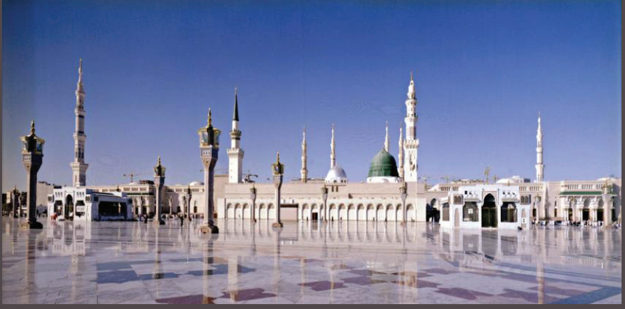
(Peygamber Efendimizin Kabrinin bulunduğu yer. Mescid-i Nebevi-Medine)