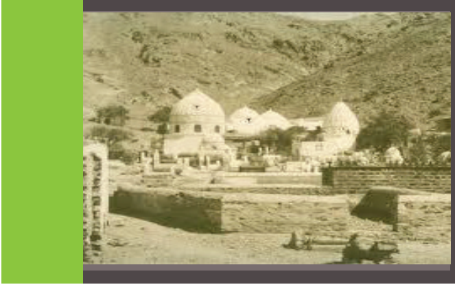
(Peygamber Efendimizin doğduğu şehir MEKKE)