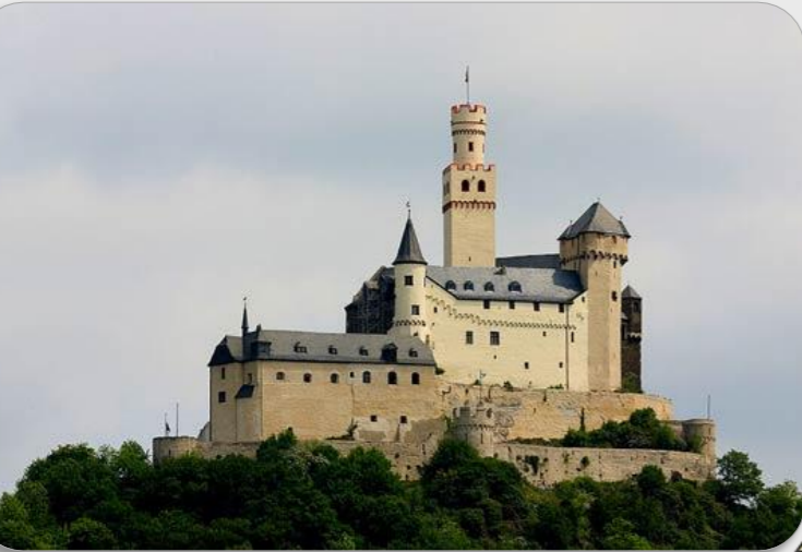
Marksburg Kalesi (1117), Braubach, Rineland-Palatinate, Almanya

Yeni Çağ 'ın başlarında ateşli silahlar ın kullanılmaya başlanması ve mutlak krallıklar ın güçlenmesiyle derebeylik güç kaybetmeye başlamıştır.