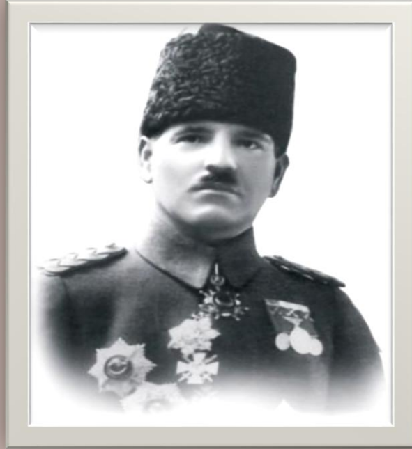
Ali Fuat Cebesoy

Samsun'da İlk iş olarak; Erzurum'daki Kazım Karabekir Paşa ve Ankara'daki Ali Fuat Paşa ile bağlantı kurdu.