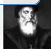
Vasco da Gama